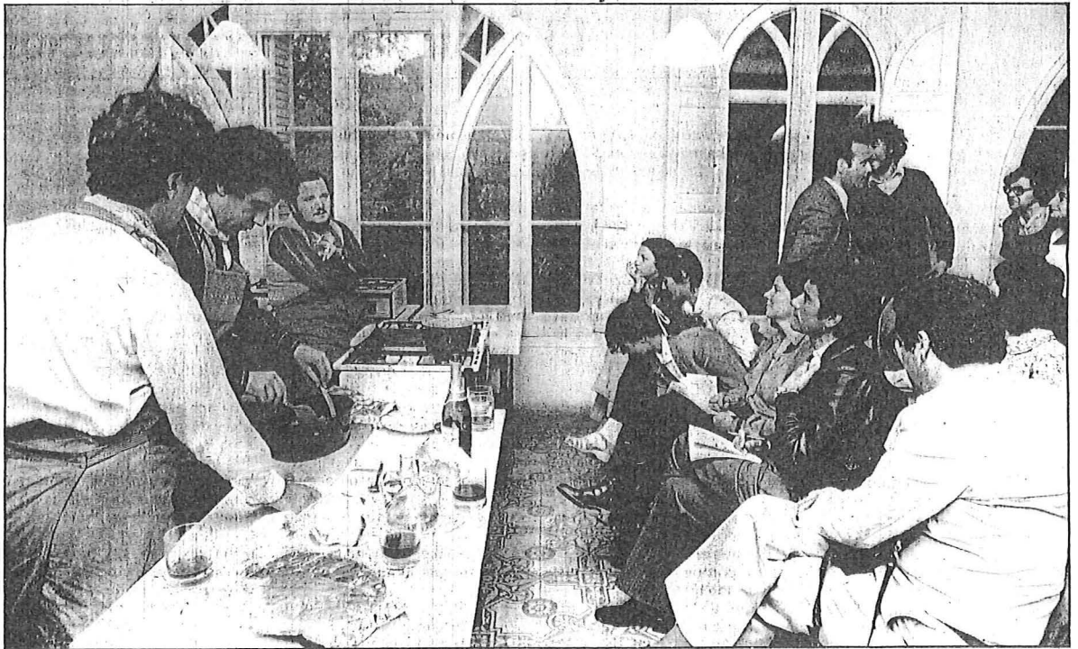
La sensualidad del olor y el sabor.